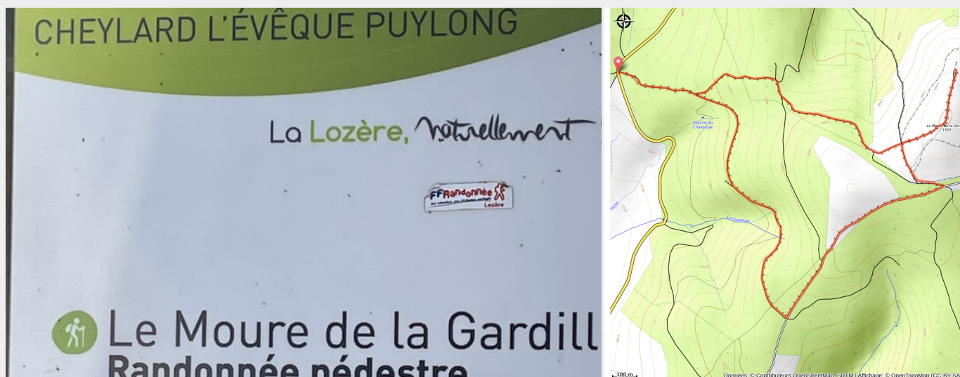
Panneau de départ de la randonnée (CCHA)

Deux sources importantes sont situées sur la montagne, à moins de 2 km l'une de l'autre : celles de l'Allier et du Chassezac qui n'alimentent pas le même bassin. En effet, l'Allier se jette dans la Loire (océan Atlantique) alors que le Chassezac descend vers l'Ardèche et le Rhône (mer Méditerranée).