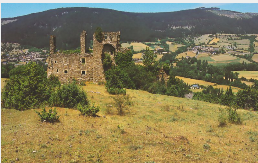
Ruines du château de Montialoux (Inventaire régional Languedoc-Roussillon)