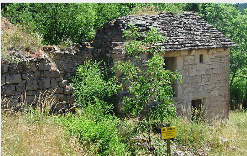
Hameau abandonné de la Chaumette (OTI Mende)