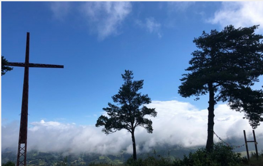
la croix de Roqueprins (Mathilde Sagnes)