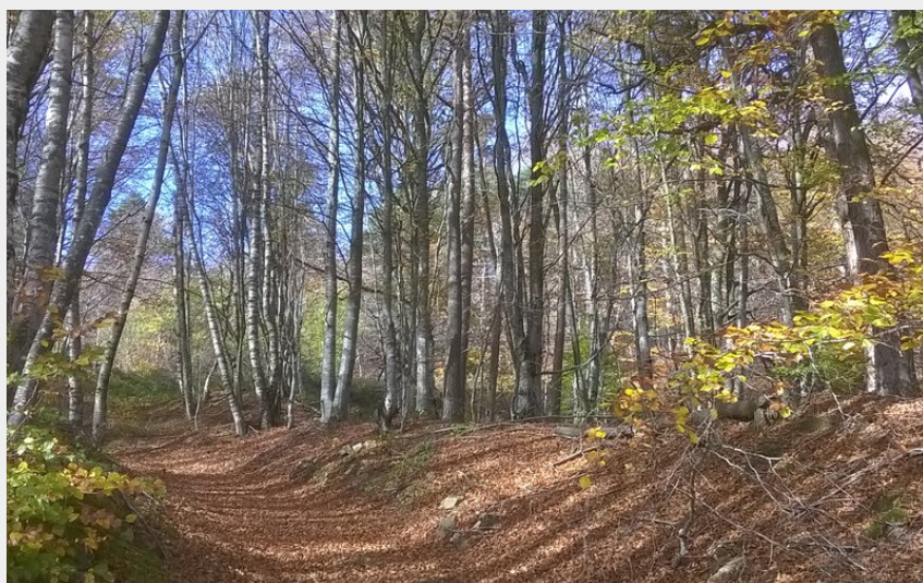
Chemin dans les sous bois (JeanLouisBEDOS)